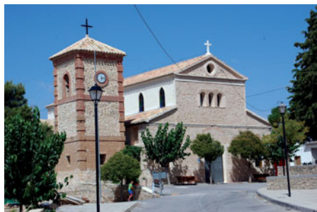
Iglesia de la Purísima. Cañada de la Cruz.

Calle De Las Monjas, 17. 30400 Caravaca de la Cruz Tel: 968 702 424 - 968 701 003 - Fax: 968 700 952 Web: www.turismocaravaca.org Email: info@caravaca.org Horario de atención: Lunes a sábado: 10:00 a 14:00 h y de 16:00 a 19:00 h (en verano de 17:00 a 20:00 h). Domingo: 10:00 a 14:00 h.