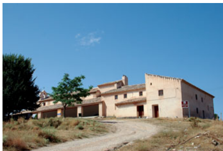
Ermita de la Rogativa.