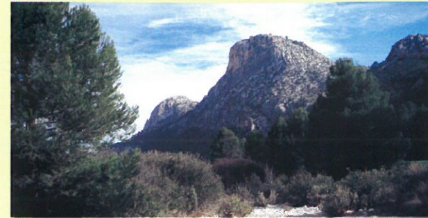
De regreso a Casas Nuevas nos adentramos en el cauce del río Pliego, hacia el Morrón de la Cabra. / On our return to Casas Nuevas, we go deep into the bed of the River Pliego, heading for the Morrón de la Cabra.

que, hasta llegar al cruce de subida al Collado del Portillo (km 10,7 / Alt. 593 m) y bajamos de frente realizando un giro a derecha para cruzar el canal del Taibilla (Km 11,1 / Alt. 572 m) y pasar ante una casa de madera.