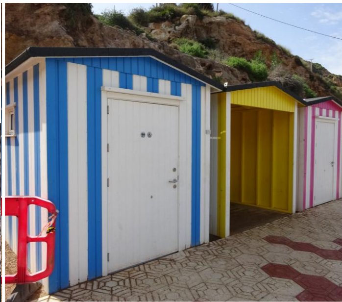
3 Aseo, zona de sombra y vestuario