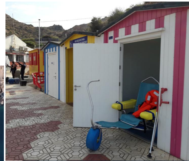
4 Silla y muleta anfibia