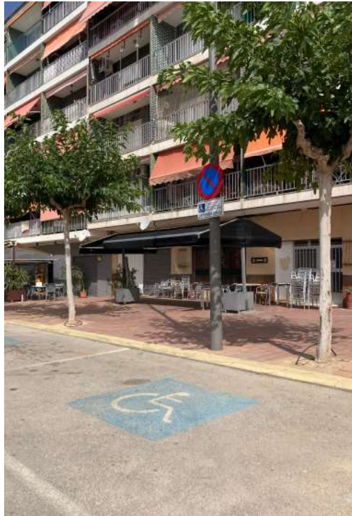
5.1_PLAZA DE APARCAMIENTO