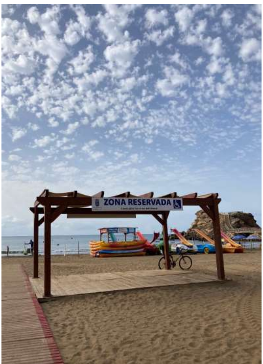
3_ZONA DE SOMBRA. SILLA, MULETAS Y ANDADOR ANFIBIO