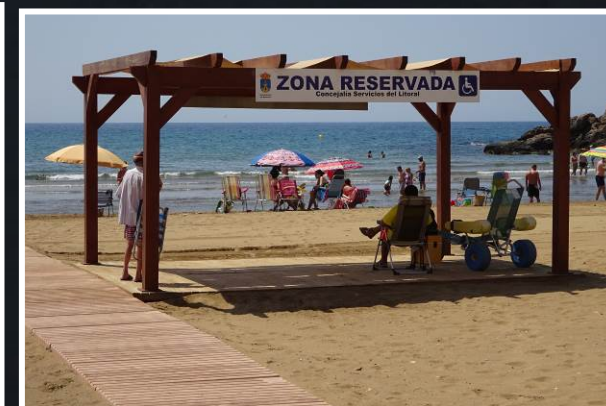
4 Zona de sombra