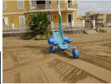
6 Silla anfibia