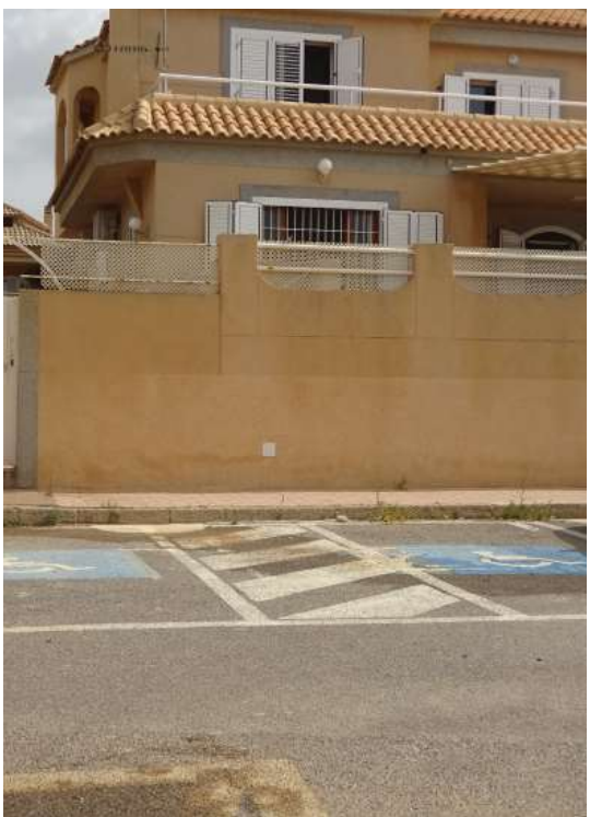
5.3_PLAZA DE APARCAMIENTO