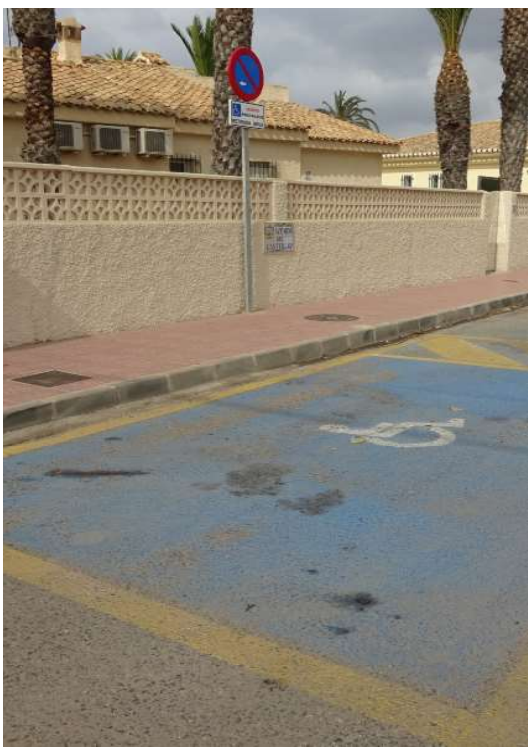
5.2_PLAZA DE APARCAMIENTO