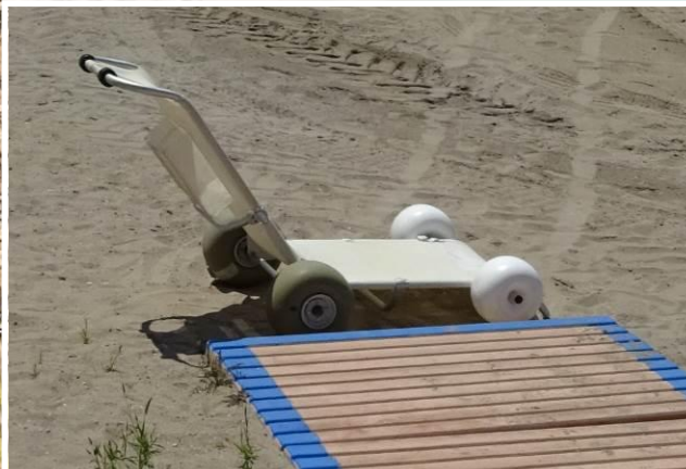
5 Silla anfibia