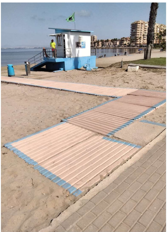
3_ZONA DE SOMBRA. SILLA ANFIBIA