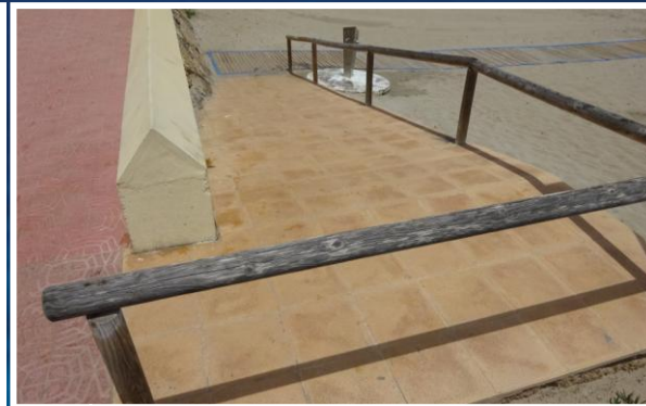
3 Rampa de acceso