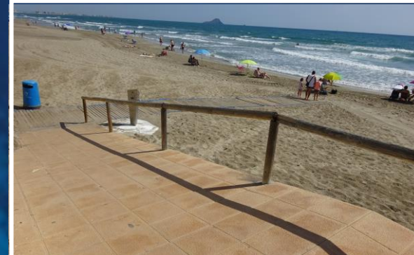
3 Rampa de acceso