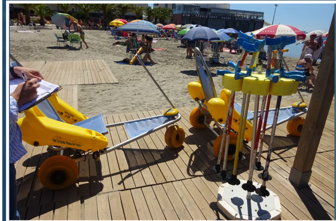
5 Sillas anfibas y muletas