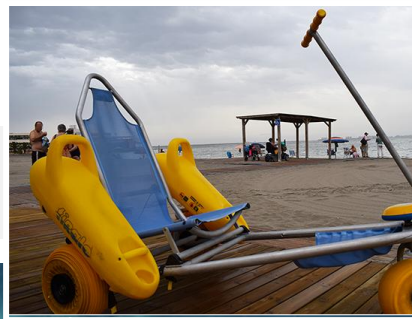
5 Silla anfibia

San Pedro del Pinatar - Mar Menor - 2019