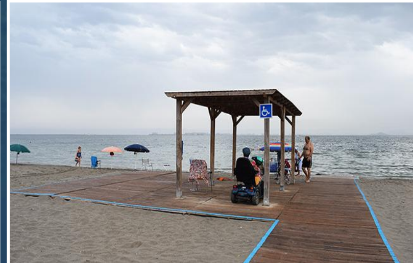
4 Zona de sombra