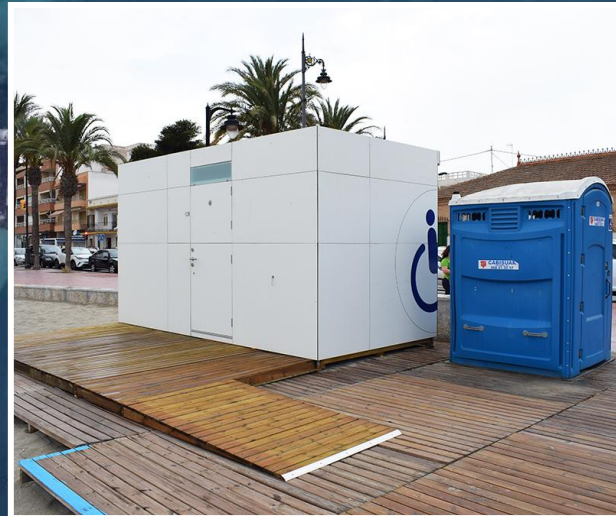
3 Aseo y vestuario