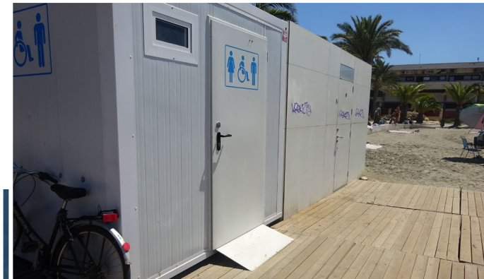
4 Aseo, vestuario y ducha