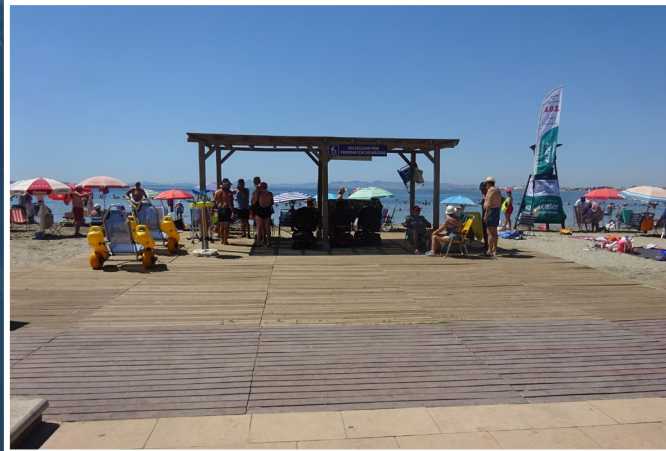
3 Pasarela y zona de sombra