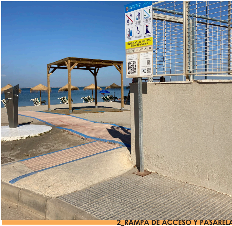
2_RAMPA DE ACCESO Y PASARELA