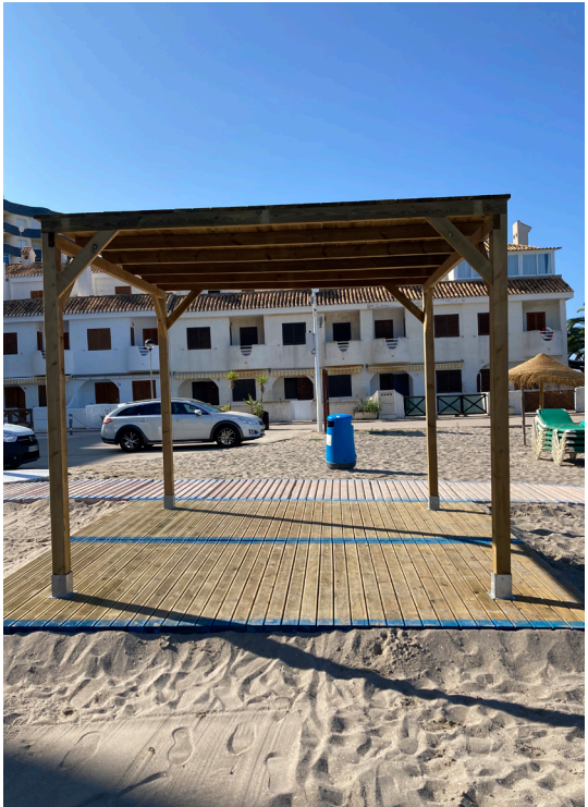
3_ZONA DE SOMBRA