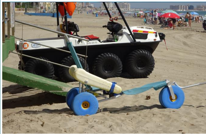
4 Silla anfibia