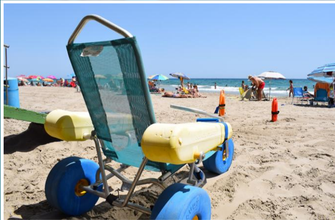
4 Silla anfibia