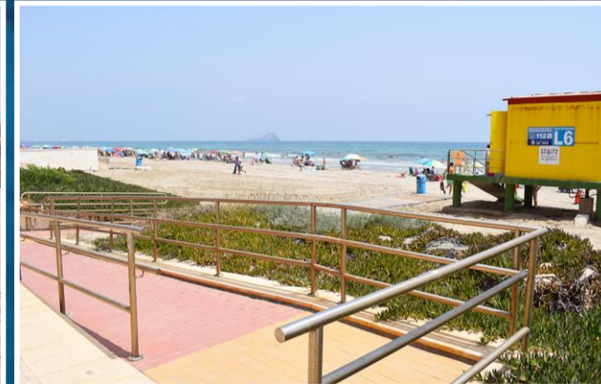
3 Rampa de acceso