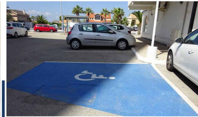
L7 Aparcamiento (Urb. La Manga Beach)