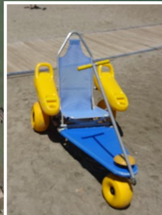
5 Silla anfibia