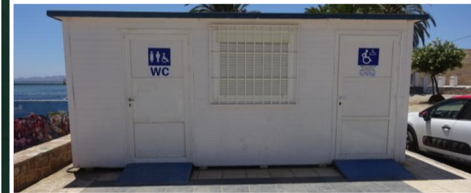
3 Aseo y vestuario