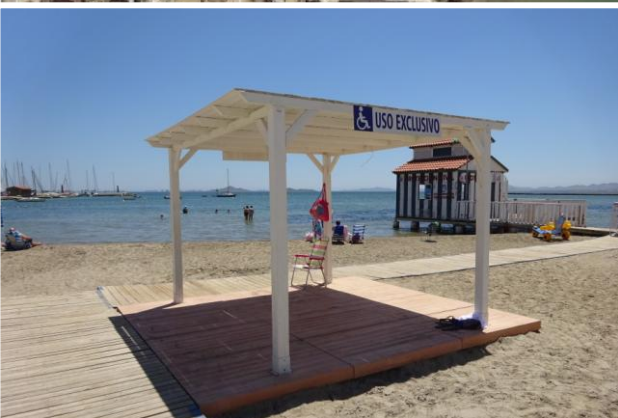
4 Zona de sombra