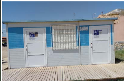
3 Aseo y vestuario