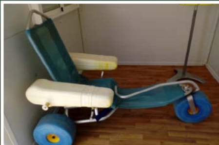
6 Silla anfibia