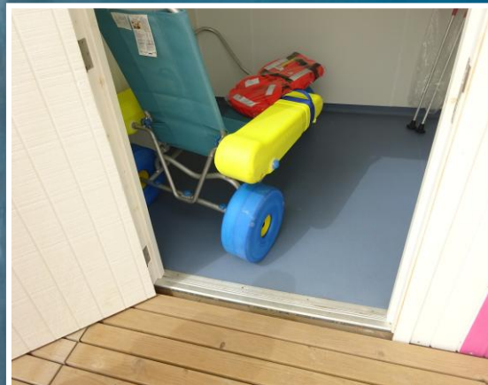
5 Silla y muleta anfibia