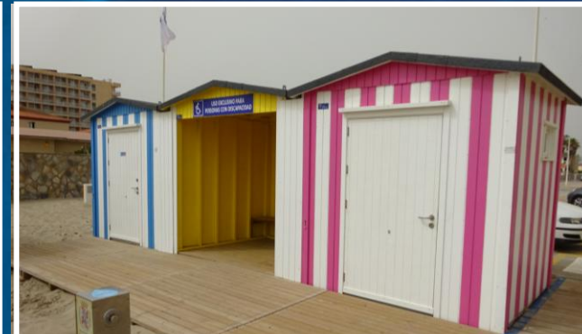
4 Aseo, zona de sombra y vestuario